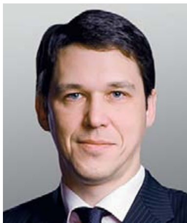
Авербах Владимир Евгеньевич, директор департамента развития электронного правительства Министерства связи и массовых коммуникаций Российской Федерации